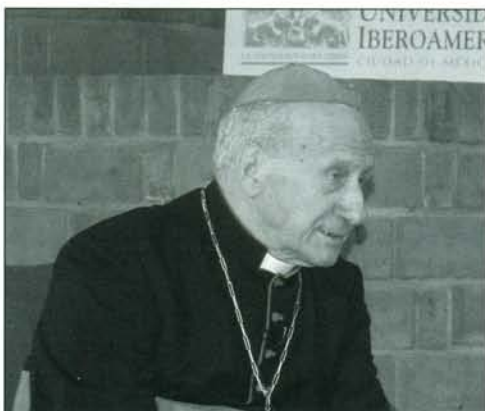
Cardenal Roger Etchegaray

Con motivo del Jubileo del Año 2000 brindó también ideas de gran repercusión, dentro y fuera de la Iglesia católica, sobre el milenio que recién comienza, y sobre la cuestión social ha escrito que "el escándalo de la opulencia de unos pocos frente a la pobreza de la mayoría muestra que está fracasando la verdadera cohabitación solidaria humana en la era de la globalización".